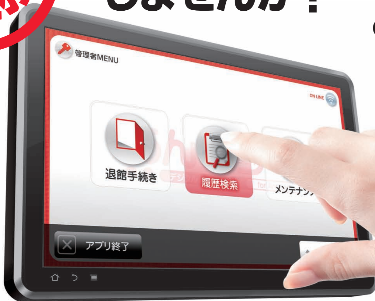
【7インチ実寸大】※写真は製品イメージです。