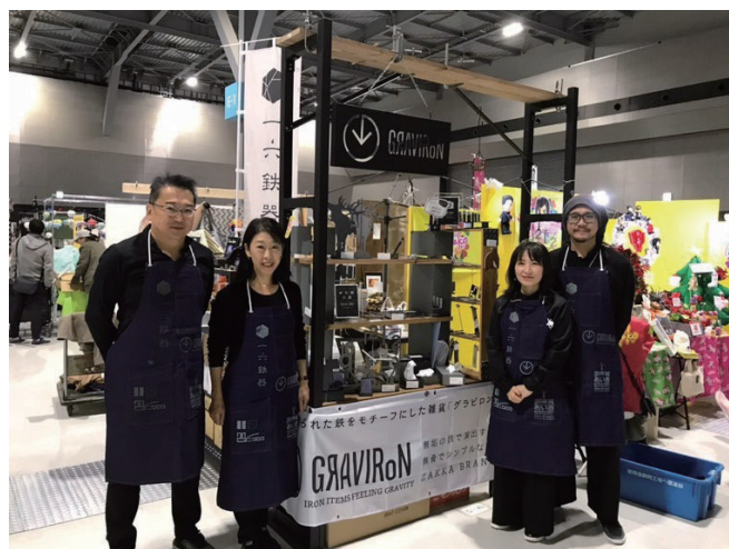
製造工場社長とデザイナーの共同でイベント出展

2019年は日経MJさん・livedoorニュースさんなどを始め、メディア掲載・出演、ネットニュースなど、露出回数が10数回。