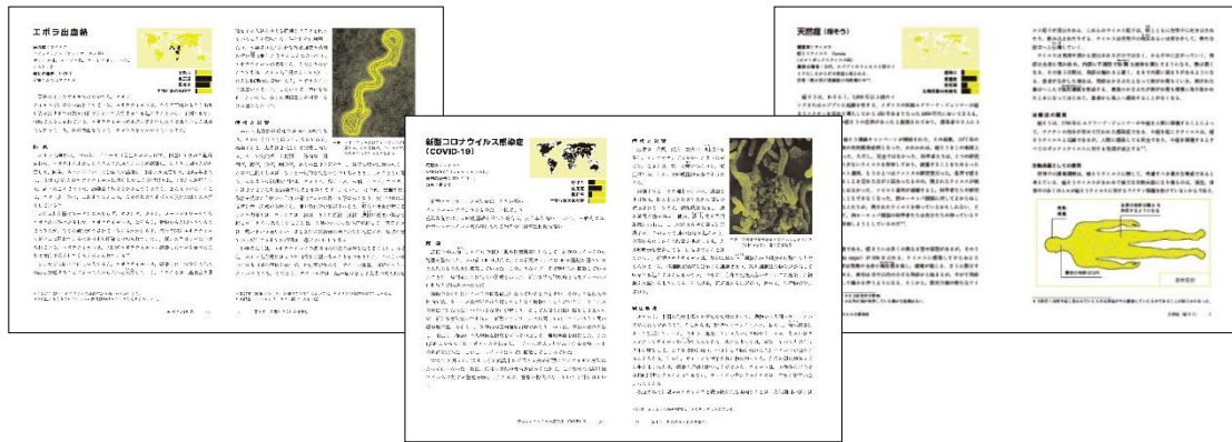
誌面レイアウトサンプル (実際の誌面とは一部異なります)