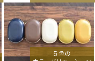
5色のカラーバリエーション