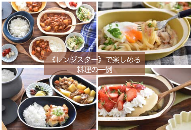
《レンジスター》で楽しめる料理の一例

さらに蓋と本体、それぞれに深さがあり、そのまま食器として使用することが可能。蓄熱性が優れているので、アツアツの美味しさを、一般的な食器よりも長く楽しめます。