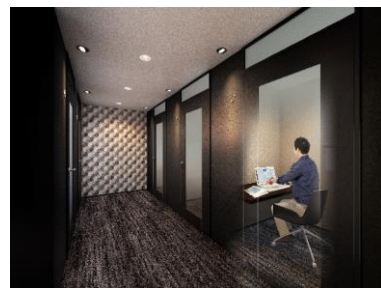
「テレワークスペース」

共用空間「リンクコム」の一角には、新しい働き方であるテレワークに対応する個室型ワークスペースを配置し、自宅ではワークスペースが確保できない、家族が居て集中できない、オンオフの切り替えが上手くできない等の悩みを解決します。時間貸し利用を想定しており、周りを気にすることなく集中して仕事に取り組みます。