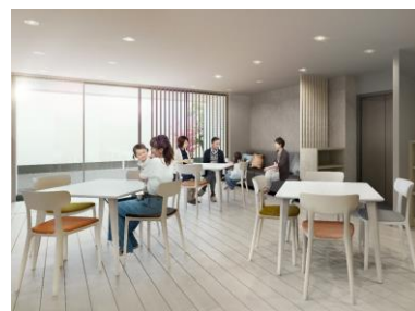
「パーティールーム」

「パーティールーム」はマンション外からの出入りを想定して外部に向けて出入口を設置し、建物外側の「イベントスペース」と合わせてさまざまな用途に対応可能です。あらゆる世代が楽しめる多様なイベントの開催を予定しています。