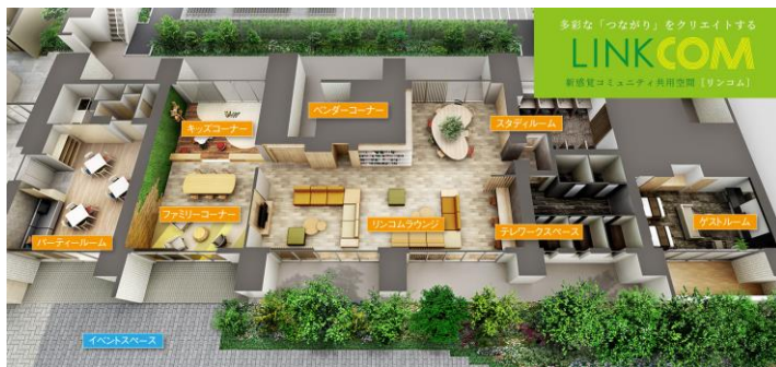
共用空間「リンクコム」

マンション住民でシェアするリビングをイメージした「リンクコムラウンジ」は、中央に大きな本棚とゆったりとしたソファが設置され、BGMが流れるくつろぎの空間です。学校帰りの小学生が親の帰りを待つ場所にもなるよう、お友達と宿題ができる大きめのテーブルも設置しています。この空間を中心に、子育て中の親子がのびのびと遊ぶことができる「キッズコーナー」、家族でリラックスできる「ファミリーコーナー」、受験生の勉強場所にもなる「スタディールーム」等へと緩やかに繋がります。住民が気軽に立ち寄れる空間とすることで、マンション内のコミュニケーションを促し、コロナ禍で住戸内で過ごすことが多い中、広々とした空間をマンション内の第2のリビングとして利用できます。Wi-Fi環境も整備し、お手持ちのタブレット端末等で雑誌の閲覧ができるサービスを導入予定です。さらに、グランドエントランス・サブエントランス・「リンクコムラウンジ」出入口には、登下校「ミマモルメ」※1のセンサーを設置し、お子さまの通過情報を登録者へメールで通知いたします(ご利用には有料の利用登録が必要です)。さらに、より安心して過ごしいただけるよう、室内の手の触れる箇所に抗ウイルス・抗菌コーティング※2を施工します。