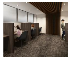
「スタディールーム」

※1:登下校「ミマモルメ」とは、ハンズフリーの無線ICタグを通学靴に入れるだけで、お子さまの小学校の登下校に加えて、マンションのセンサー導入場所を通過する際に、その保護者の方にお子さまの通過情報をメールでお知らせするサービスです。(ミマモルメは株式会社ミマモルメの登録商標です。)