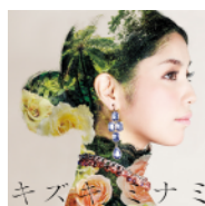
2015.11.04 オリジナルアルバム 『尊々加那志～トウトガナシ～』 PCCA-04286