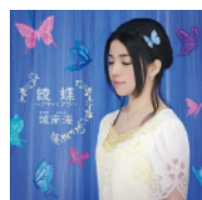
2014.02.26 オリジナルアルバム 『綾蝶～アヤハブラ～』 PCCA-03998