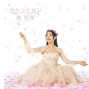
2015.01.21 カバーアルバム 『サクラナガシ』 PCCA-04146