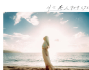
2016.11.16 オリジナルアルバム 『月下美人』 PCCA-04443