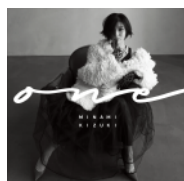
2019.12.18 オリジナルアルバム 『one』 PCCA-04877 / PCCA-04878