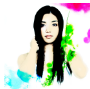
2009.08.19 オリジナルアルバム 『加那 - イトシキヒトヨ -』 PCCA-03733/PCCA-03734