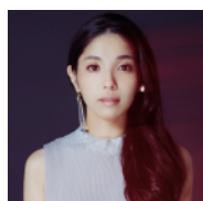
2017.11.22 カバーアルバム 『ユキマチヅキ』 PCCA-04593