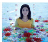
2019.05.08 ベストアルバム 『ウタツムギ』 PCCA-04779/PCCA-04780