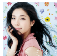
2015.06.17 カバーアルバム 『ミナミカゼ』 PCCA-04231