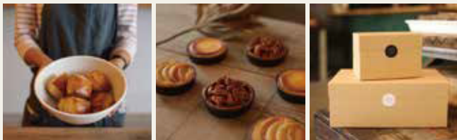
焼菓子 ¥220～ パウンドケーキ ¥270～ タルト ¥350～ クラフトボックス ¥110 (タルトは8月初旬から提供いたします。価格は税込み価格です。)