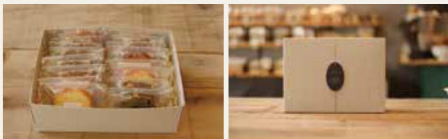
パウンドケーキ（ギフトボックス入り）10ヶ詰 ¥3000～