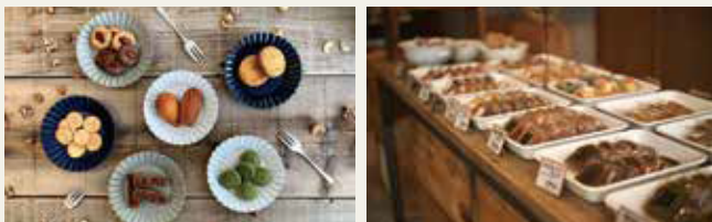
パティシエが手作りでこころを込めてつくっています。