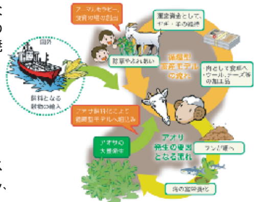
【循環型畜産体系システムの構築図】

3. ヤギ・羊を放牧する場所をあらかじめ告知したり、イベントを開催する事で、地域の方とのふれあいの場を提供し、人々の笑顔と活気を与えます。