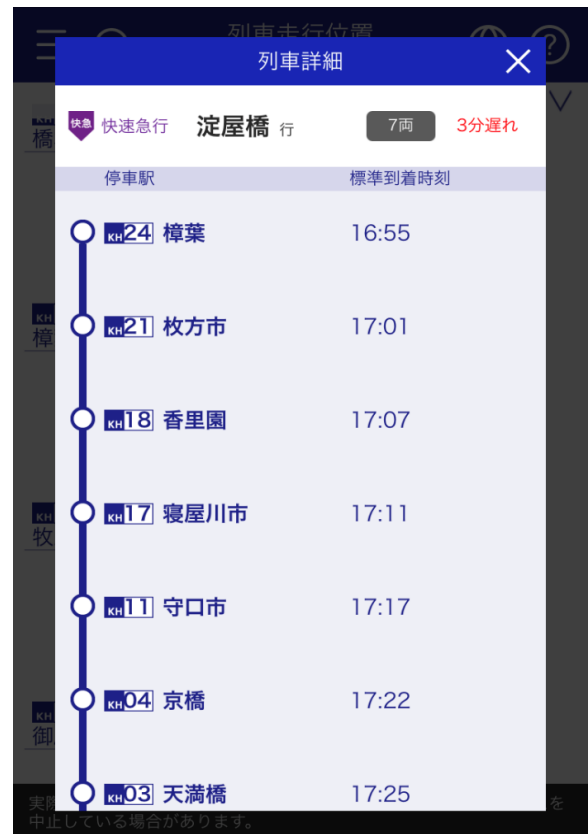
サービス提供画面(イメージ)