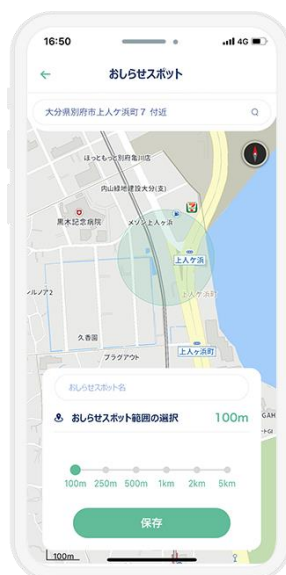
2. 出発と到着を教えてくれる