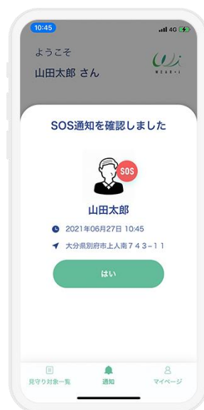
3. 緊急通知ボタンでSOSを通知