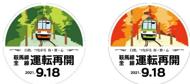
ヘッドマークデザイン