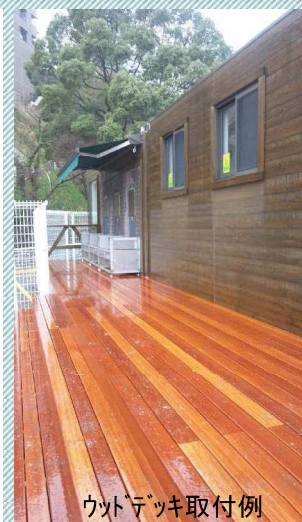
ウッドデッキ取付例