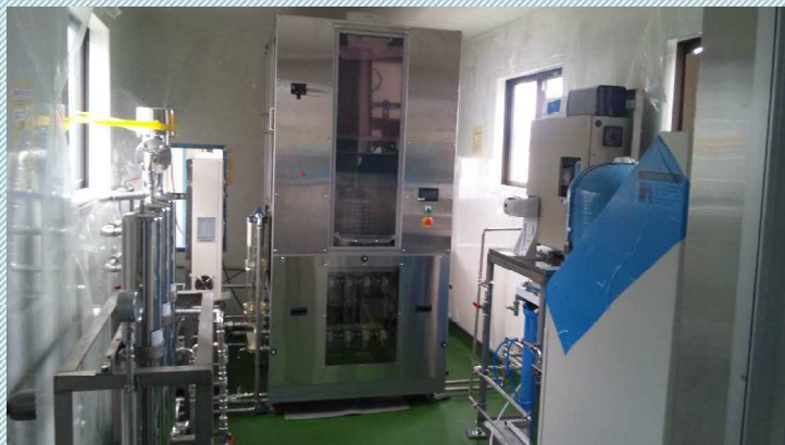
製造室(クリーンルーム)