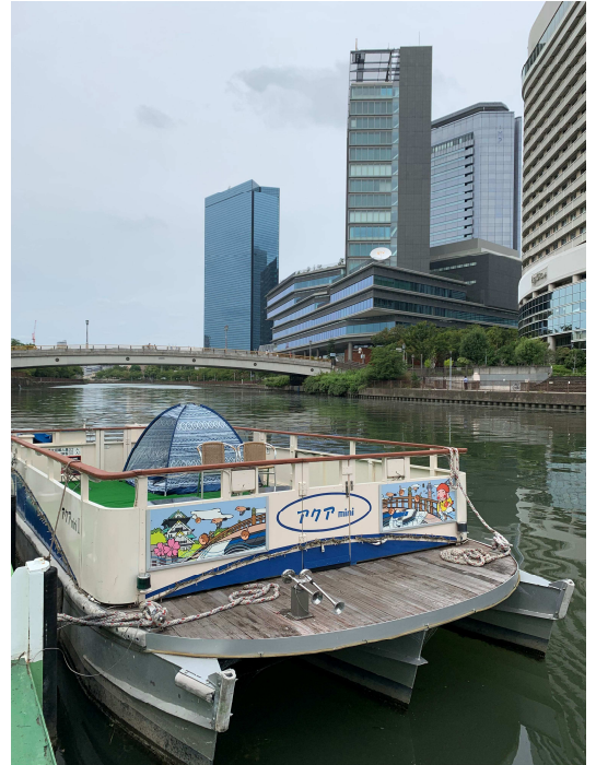
(イメージ：ほんわかファミリー号/アクア mini)