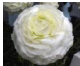
【ビガー・ホワイト】