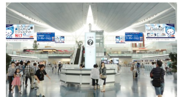
【空港フラッグ】※イメージ

7月に羽田空港国際線出発ロビーにて展開予定。これから世界へ羽ばたくヒラカワの「ひんやりジェルマット」をグローバルにアピール。