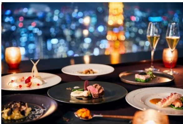
XEX ATAGO GREEN HILLS / Salvatore Cuomo Bros.

「XEX(ゼックス)」やイタリアンレストラン「SALVATORE CUOMO(サルヴァトーレ クオモ)」などを手掛ける株式会社ワイズテーブルコーポレーション(代表取締役社長：船曳 睦雄、本社：東京都港区赤坂)では、2021年11月15日(月)よりXEXグループ各店でクリスマスコースの予約受付を開始いたします。クリスマスにしか味わえない料理の数々をお楽しみください。