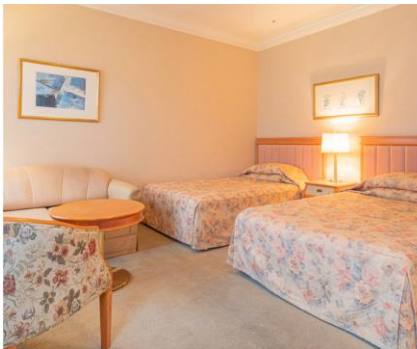
犀北館ホテル客室

今回新商品の認知拡大のため、“初夢枕札”(枕の下に敷いてよい初夢を祈願する縁起物)が、130年以上の歴史を持つ長野市のクラシックホテル「犀北館ホテル」と、東京 水道橋の「庭のホテル 東京」で、宿泊客へのプレゼントキャンペーンに採用されることになりました。(キャンペーン詳細別紙参照)これは、新型コロナウイルス流行の中、2022年こそ良い年になるようお願いを込め、日本古来の縁起物“初夢枕札”を復刻し、少しでも多くの方々に体験頂きたいという当社の思いに賛同いただき実現したものです。