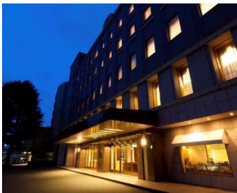
犀北館ホテル 外観