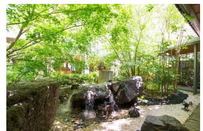
庭のホテル 東京 庭園