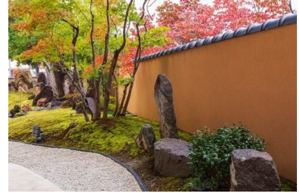
犀北館ホテル 庭園