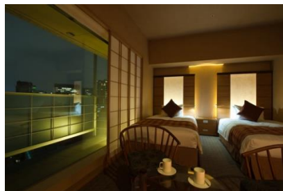
庭のホテル 東京 客室