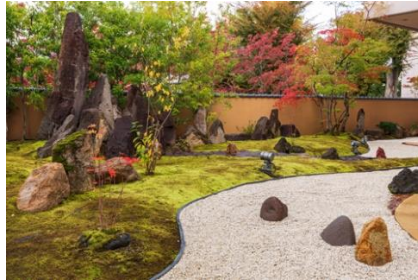
犀北館ホテル 庭園