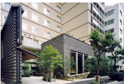
庭のホテル 東京 外観