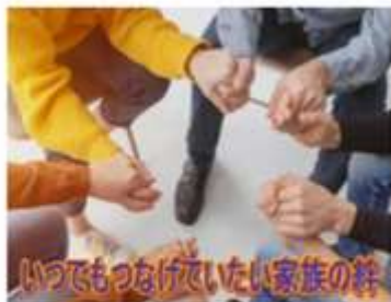
いつでもつなげたい家族の絆