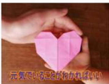
元気でいることがわかればいい