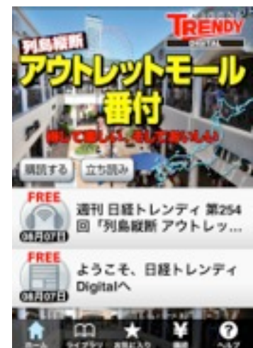
アプリのトップ画面