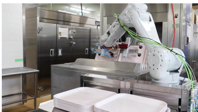
洗浄後のトレイを回収