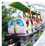
サイクルコースター