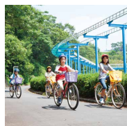
ファミリーサーキット