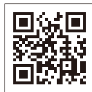
▲ ホームページ ▲