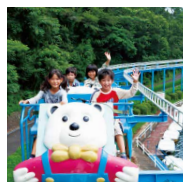
サイクルモノレール