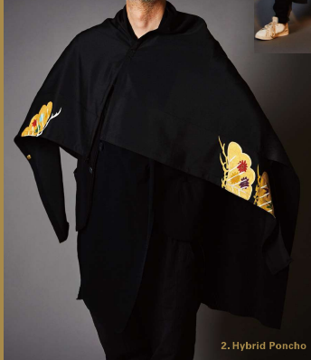
2. Hybrid Poncho