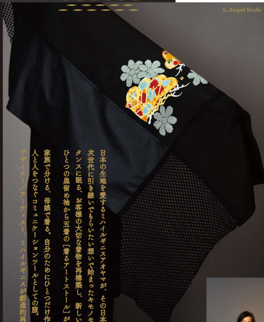
5. Angel Stole