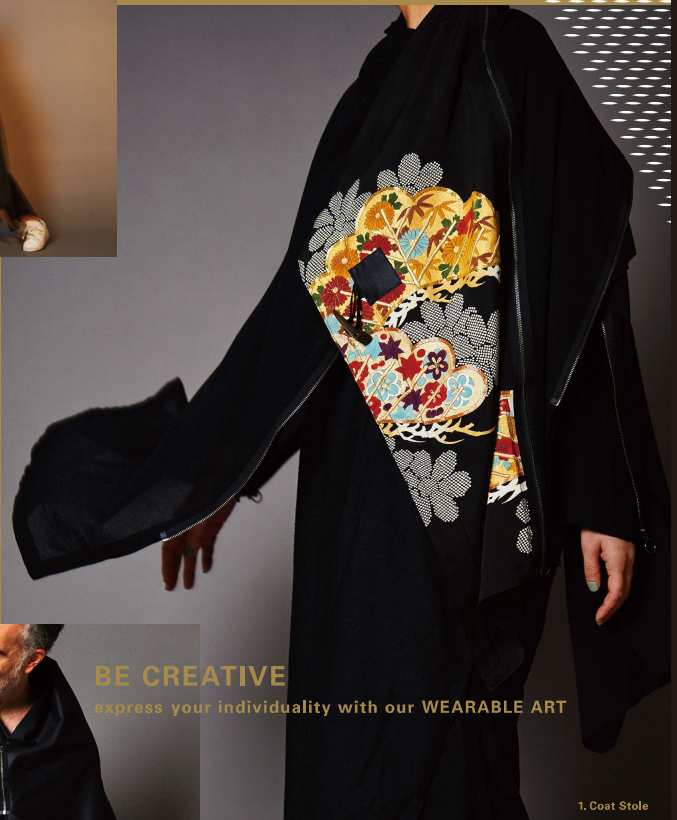
1. Coat Stole