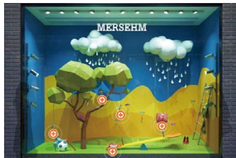
ウィンドウディスプレイ出店・広告掲載