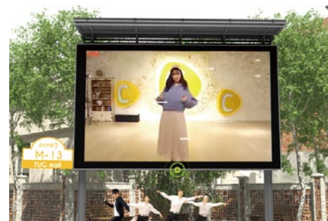
動画コマース出店・広告掲載