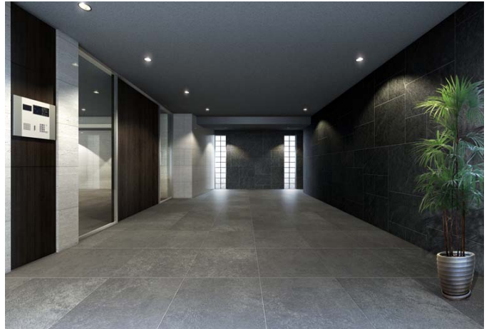
【エントランスホールイメージ】