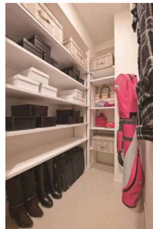
【シューズインクローゼット】

バスルームにはオートバスを採用し、自動追い焚きや足し湯で、いつでも快適なバスタイムが楽しめます。