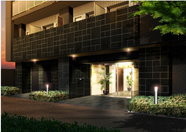
【エントランスイメージ】