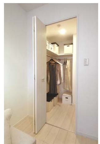
【ウォークインクローゼット】