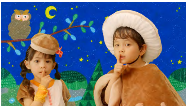
▲クレヨン画による温かみのあるイラスト