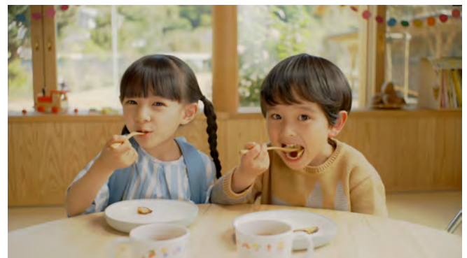
▲しいたけが大好きになった子供たち