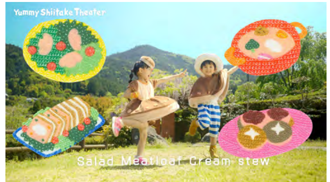
▲英語ver.「Yummy Shiitake Theater」