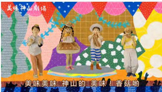
▲中国語ver.「美味神山劇場」