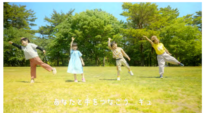
▲みんなで踊れる「ダンス編」も3ヶ国語で制作