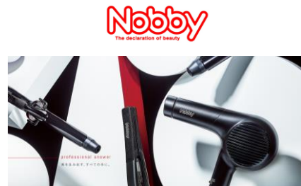
サロンシェアNo.1※1ブランド Nobby

ブランドサイトURL： https://www.tescom-japan.co.jp/brand/nbt/