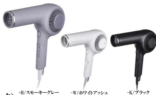
-H/スモーキーグレー

カラー：-H(スモーキーグレー) / -W(ホワイトアッシュ) / -K(ブラック)