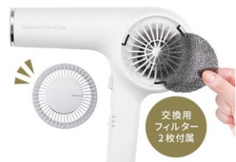
フィルターイメージ

フィルターは取り外せて洗え、いつでも清潔に使えます。交換用フィルター 2 枚も付属しています。