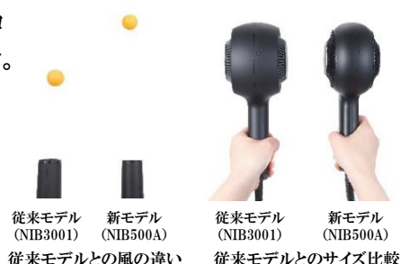
従来モデル (NIB3001) 新モデル (NIB500A)

本製品で、髪を素早く、美しく乾かしたいというニーズに応え、今後もサロンシェアNo.1※1ドライヤーメーカーとして、みなさまの「キレイ」を支える製品の開発に努めてまいります。