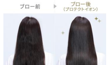
プロテクトイオンによる仕上がりイメージ

プラスとマイナスのイオンを同時に放出。それぞれのイオンが髪に働いて静電気を抑制し、髪の広がりやゴワつきといった様々な髪悩みを解決します。