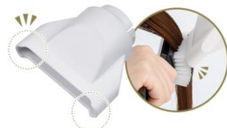
セットフード使用イメージ