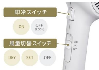
スイッチ構成イメージ

従来品から約4%軽量化※9し520gに。プロ用ドライヤーと同じスイッチ構成で、冷風に切り替えできる「即冷スイッチ」と、強風と弱風の2段階が選択できる「風量切替スイッチ」を搭載。ミニマムな機能で、ヘアードライを快適に。