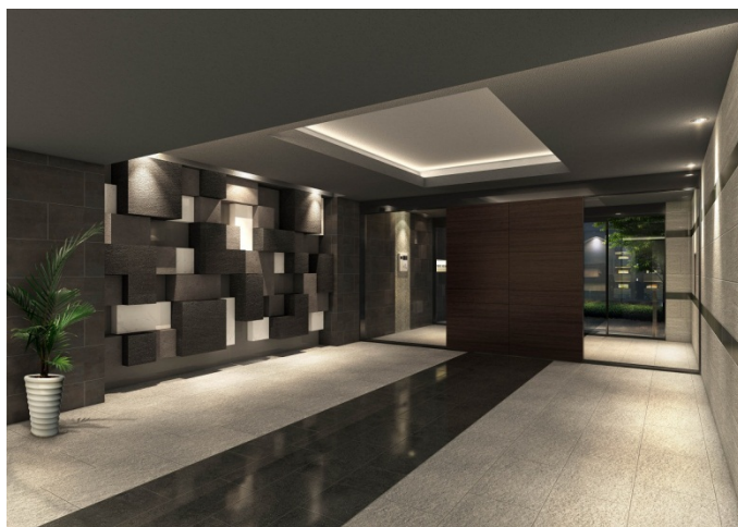
【エントランスホールイメージ】