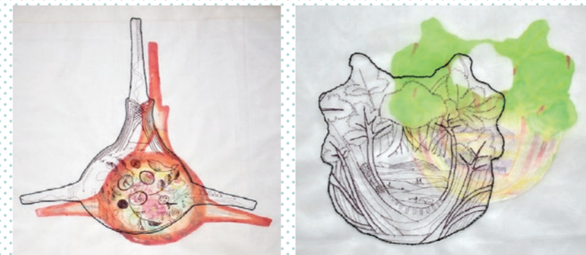
《鯨骨6演「鯨骨とハマナス」》