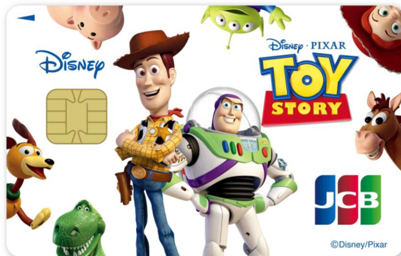
ディズニー★JCB カード「トイ・ストーリー」（一般カード） ©Disney/Pixar

ディズニー公式の唯一のクレジットカード「ディズニー★JCB カード」のカードラインナップに、この度、新デザイン「トイ・ストーリー」が追加となりました。お客様の安全・安心のために大切なカード情報を裏面に集約し、キャラクターデザインがより映える券面となっています。