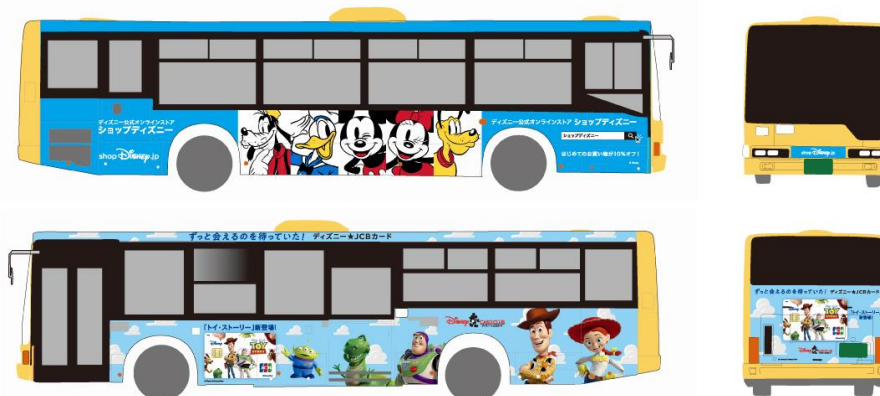
▲車体ラッピングデザイン（鹿児島市営バス）