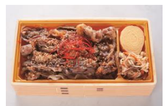
▲ 宮崎牛使用カルビ重