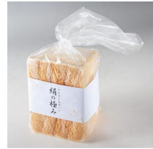
▲ 生食パン絹の極み

自社厨房で丁寧に焼き上げたこだわりの自社パンを多数のラインナップでお届けします。一番のおすすめは、最高級小麦粉に生クリーム・バター・ハチミツを配合したフレスト生食パン「絹の極み」。生で食べて美味しいふんわりしっとり食感の食パンです。