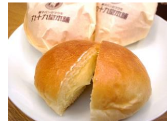
▲ 九十九堂本舗クリームパン

枚方が生んだクリームパンの銘店「九十九堂本舗」のクリームパンや、創業180年の老舗店「大黒屋」のおいも巻やスフレチーズケーキのほか、香里園 成田山不動尊近くの人気和菓子店「菓匠香月」の餅パイも新たにレールグルメに仲間入りします。その他にも、枚方穂谷産ホップを使用した「カンパイクンパニー」のクラフトビールを販売するほか、枚方の老舗製麺メーカー「恩地食品」、同じく枚方の老舗豆腐メーカー「丸福食品」と共同開発した当社限定商品も品揃えします。