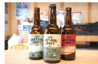
▲ カンパイクンパニークラフトビール