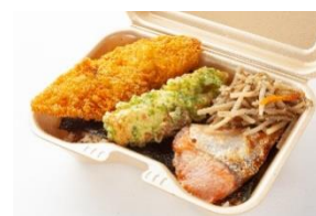
▲ 鮭が入ったのり弁