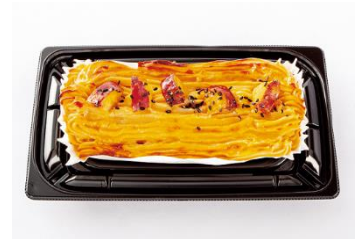
▲ 自社製スイートポテト

当社パティシエ手作りの自社製スイーツのほか、バイヤーが全国から発掘したおすすめスイーツを豊富に品揃え。毎日来ても飽きない豊富な品揃えでお待ちしております。