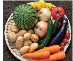
▲ 葉菜の森の野菜・果物 (イメージ)

大阪泉州「葉菜の森」の野菜・果物や地元枚方の地場野菜など、鮮度にこだわった産地直送商品を豊富に取り揃えます。そのほか、生産者指定の野菜・果物など、お客さまに安心してお買い求めいただける商品を多数ご用意いたします。