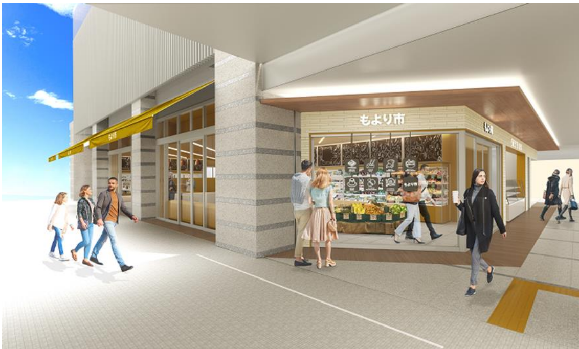
食の商店「もより市 樟葉駅」店舗イメージ