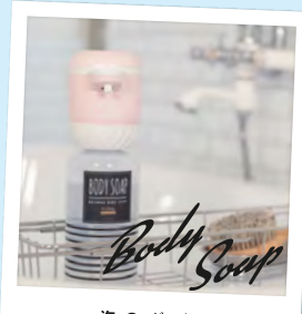
泡のボディソープ