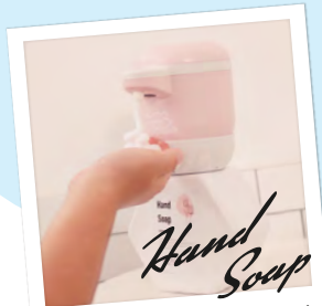
泡のハンドソープ