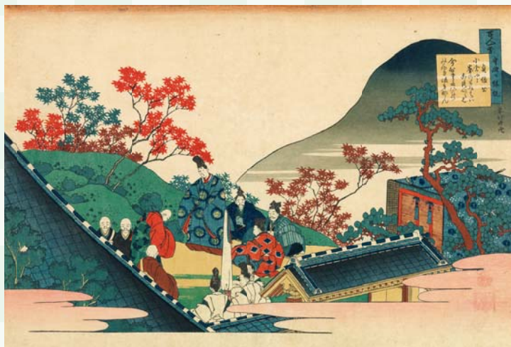
葛飾北斎「百人一首宇破か縁説 貞倍公」

『百人一首』は、江戸時代中期頃までに一般教養として広く浸透し、狂歌や見立ての形でも流通するようになったことで、より存在感を増していきます。そのような中、誰もが知る『百人一首』の歌を絵にして内容を解説する趣旨により、北斎最後の大判錦絵シリーズ「百人一首乳母か糸とき」は企画されました。本シリーズは絵の難解さなどの理由から27図のみの出版にとどまります。北斎は歌や歌人の一般的な伝承やイメージに独自の発想を盛り込み、北斎ならではの世界観を表現したのです。