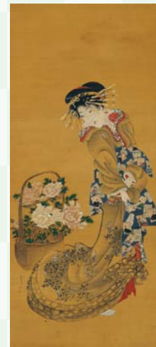
抱亭五清「美人と花籠図」

*表紙の作品: 葛飾北斎「五歌仙 月」、葛飾北斎「風流源氏かると」(部分) *全てすみだ北斎美術館蔵 *各作品の展示期間はホームページをご確認ください