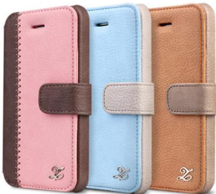
【iPhone 5 ケース Masstige E-Note Diary シリーズ】

iPhone 5 の機能を最大限に使いこなせるようにホールをデザインしました。ボタンの操作に支障が出ないようにスペースを開けており、ケースを着けたままでもスムーズに操作することができます。前面にスピーカーホールがあり、ケースを閉じたままの状態でも通話が可能になっております。