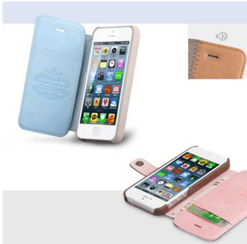
【iPhone 5 ケース Masstige E-Note Diary シリーズ】