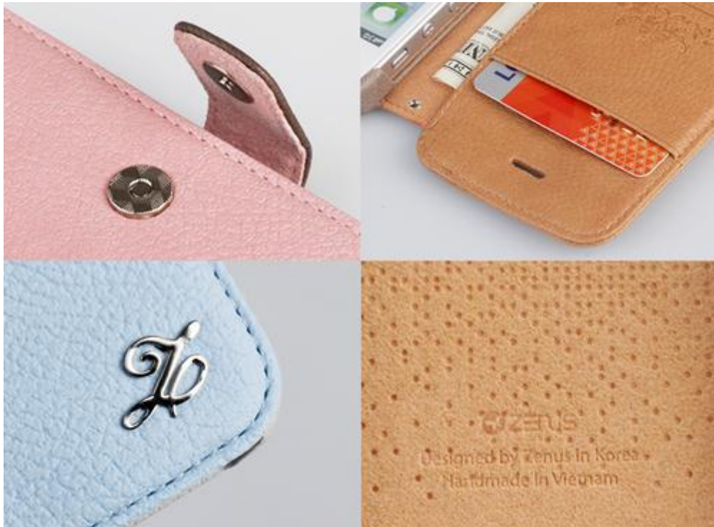
【iPhone 5 ケース Masstige E-Note Diary シリーズ】