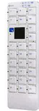
NTL-P26 Smartphone Style スマートフォン