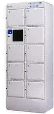
NTL-B09 Personal Style パーソナル