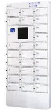
NTL-M26 Mobile Style モバイル