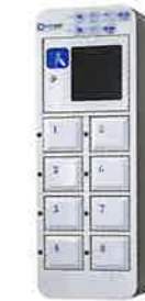
NTL-P08 Smartphone Small スマートフォン卓上