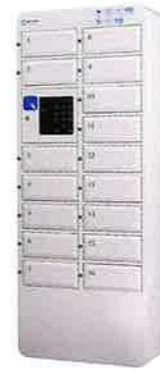
NTL-S16 Standard Style スタンダード