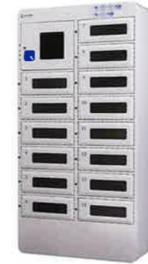
NTL-014 Office Style オフィス