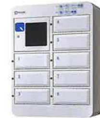
NTL-S08 Standard Small スタンダード卓上