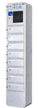
NTL-C08 Compact Style コンパクト