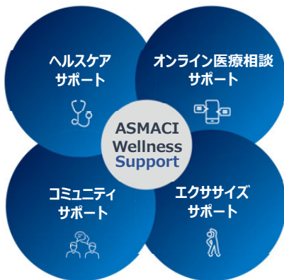
「ウェルネスサポート」イメージ

同病院との連携により、インターフォンを利用して入居者向けに情報配信するなど、病院がかかりつけ医のように健康維持・増進をサポートする「ヘルスケアサポート」や小児科・産婦人科・婦人科に特化した「オンライン医療相談サポート」、住民交流や子育て、防災などのイベントを行う「コミュニティサポート」、日々の健康づくりを支える「エクササイズサポート」を用意。これら4つの「ウェルネスサポート」によって、あらゆる世代が豊かで健康に過ごすことができるよう支えます。