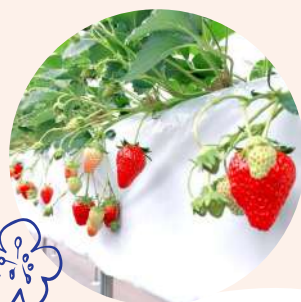
TAKEUCHI FARM 笠取 京いちご畑