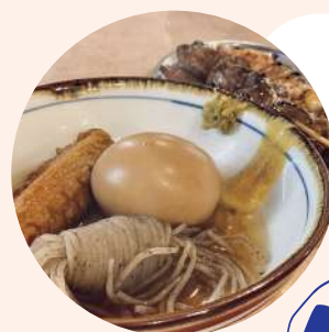
ちょい呑みはわい

残留リスクの高い農薬不使用の国産小麦を使い、宇治産平飼卵、キビ糖、天然塩、自家製酵母等材料にもこだわり、身体や環境に優しく毎日食べても飽きないパン作りを目指しています。