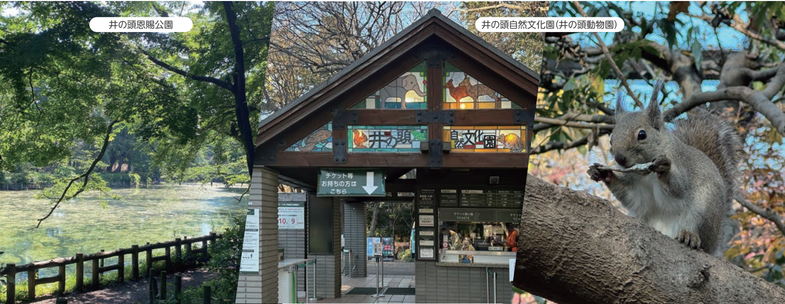
井の頭自然文化園(井の頭動物園)