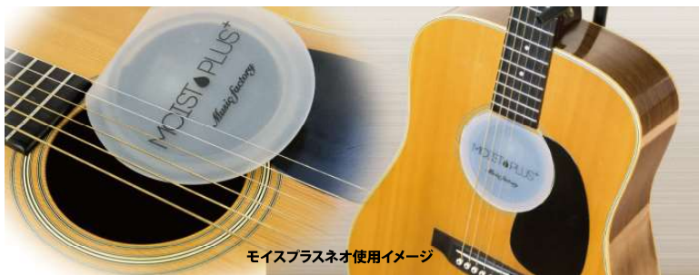
モイスプラスネオ使用イメージ

定期的に吸湿センサーシールをチェックしてください。濃いブルーになった場合、乾燥していますので、ポリエステル生地部分に霧吹き等で水を散布してください。センサーに水がかからないようご注意ください。霧吹きを使用する理由は、細かい粒子状になり、繊維の内部に入り込むためです。ホコリや汚れにより性能が低下する場合がありますので、1年程度で新品と交換することをお勧めします。