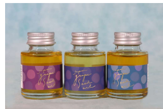
株式会社テクノボンズ グレープシードオイル