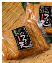
(有)亀井蒲鋒 黒胡椒フワっ天