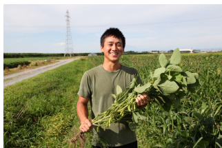
興惣兵衛 神の枝豆だだちゃ豆