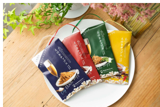
(有)南九州きのこセンター えのきチップス