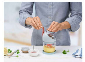
ハナエミグローバル(同) マヨネーズメーカー