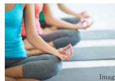
健康運動プログラム健康セミナー