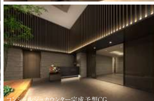
コンシェルジュカウンター完成予想CG