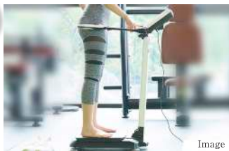
ウェルネス・ラウンジ