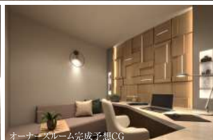
オーナーズルーム完成予想CG