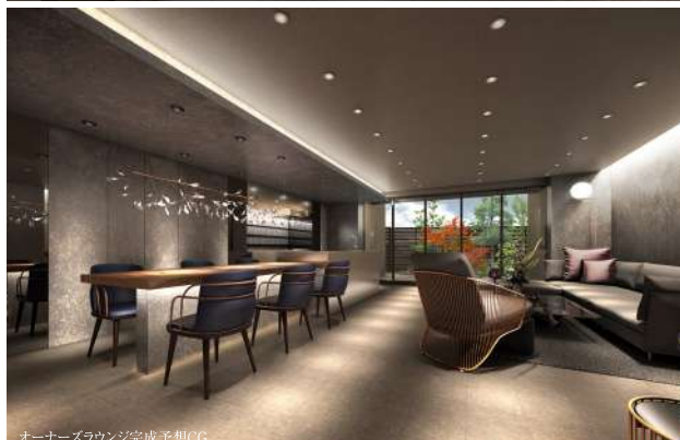
オーナーズラウンジ完成予想CG