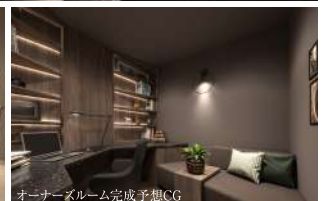
オーナーズルーム完成予想CG