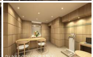
ウェルネス・ラウンジ完成予想CG