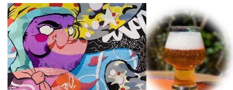
<KICHIJOJI HOLIDAY SPECIAL by CYCAD BREWING オリジナルデザイン>

ストーンフルーツやトロピカルフルーツを連想させるテイストとアロマの特徴をもつ、Citiva（シティバ）というホップを使用。吉祥寺の井の頭公園や個性豊かで明るくハッピーな街のイメージをベースに、屋外イベントにぴったりの、トロピカル&ジュシーなペールエールをつくりました。ここでしか飲めない特別なクラフトビールです。