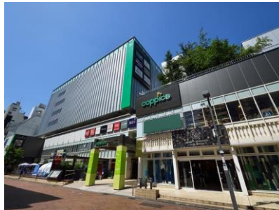
[コピス吉祥寺外観]