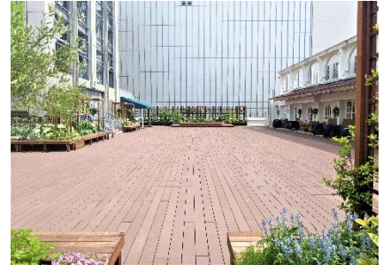
[A 館 3 階屋外スペース「GREENING 広場」]

＜この件に関する一般の方のお問い合わせ先＞ コピス吉祥寺 インフォメーション 電話 0422-27-2100