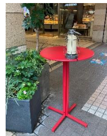
<元町通りテーブル過去開催の様子>