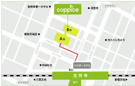
[コピス吉祥寺アクセス MAP]