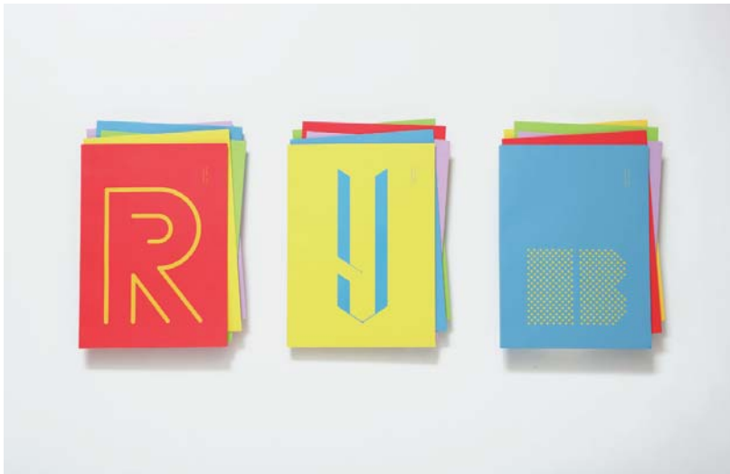
#001, LAYERED NOTE

TAKI PRODUCTSは、プロダクトを通じてヒトとヒトとの絆づくりをしています。