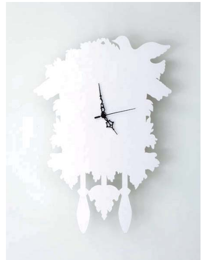
#004, ラクガキクロック HATO/FURIKO/MEZAMASHI