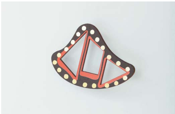
#003, scarf buckle "SUITE OF CLOTH" 太陽/地平線/月