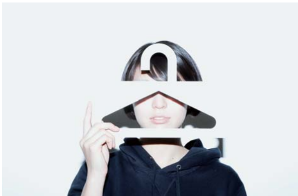
#000, A SHEET OF PAPER. SOMETIMES A HANGER. [非売品]