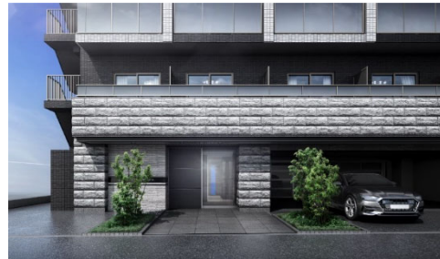
【エントランスイメージ】