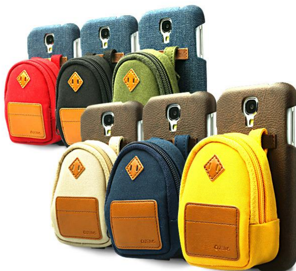
Masstige Mini Pack case