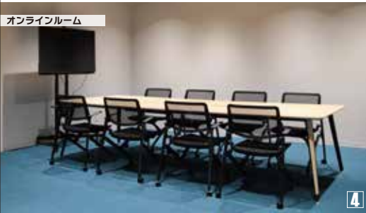
オンラインルーム