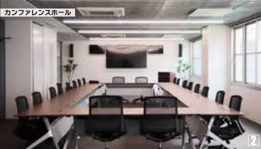
カンファレンスホール