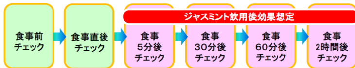
●ブレスチェック計測結果