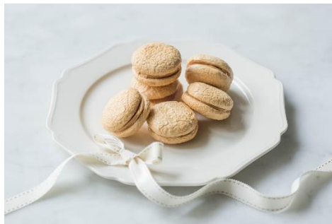
マシュマロのマカロン風（調理画像）