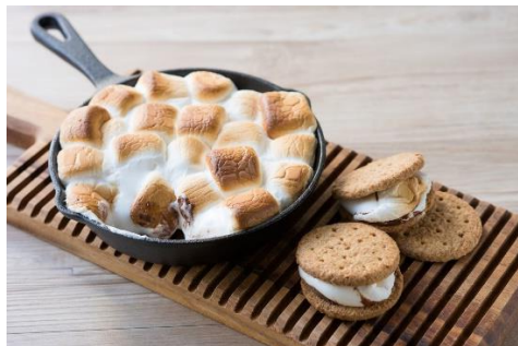
スキレットスモア（調理画像）