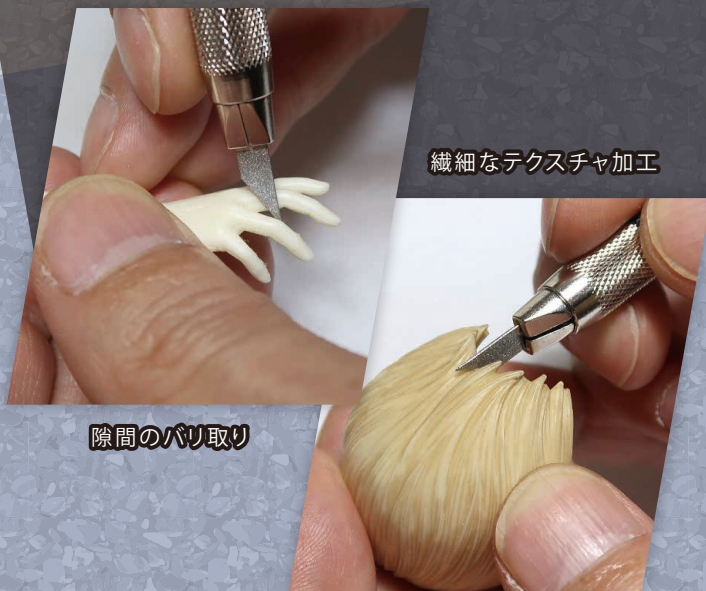
繊細なテクスチャ加工