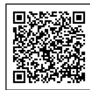
MUSEUM for NEWTOWN