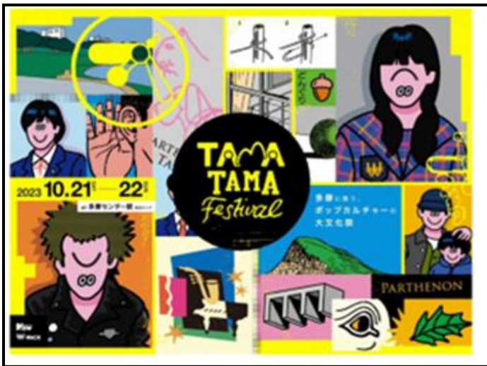
TAMA TAMA FESTIVAL 2023