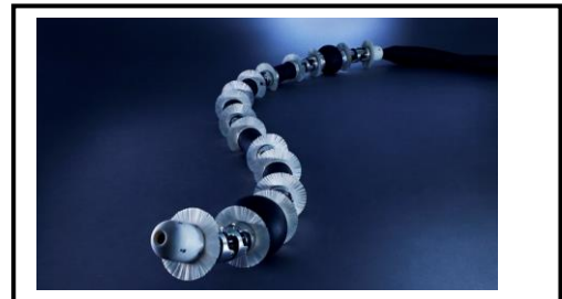
人口筋肉を使ったソフトロボット (ソラリス)