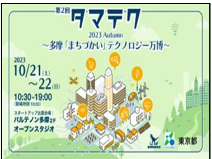
タマテク 2023 Autumn ~多摩「まちづかい」テクノロジー万博~