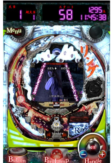
▲映画さながらのホラー演出が満載！パチンコ機オリジナルのストーリーも搭載しているので、ホラー映画のファン必見のアプリです。